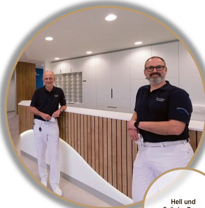
Hell und großzügig: Der neue Empfangsbereich.