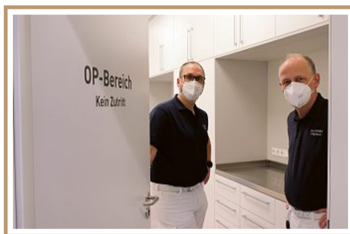
Für kleinere ambulante Eingriffe steht ein OP-Bereich zur Verfügung.