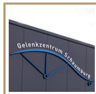
Weithin sichtbar: Das Logo des Gelenkzentrums.